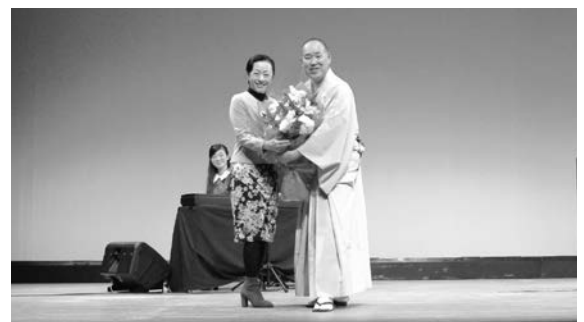
公演に先立ち、花束も贈呈された

昨年まで計7回、はがねの日の恒例イベントとして開催してきた「ファミリーコンサート」が中央公会堂の予約の関係などで開催しにくくなったことから、今年は趣向を変えて演芸ショーを開催した。第1部では「キビート(大道芸)」「ネイビーズアフロ」「スマイル」(いずれも漫才)「あやつるぼん!(マジック)」を公演。第2部では劇団四季出身の落語家・三遊亭究斗のミュージカル落語「アラジンと魔法のランプ」を熱演し、集まった会員企業の社員や家族約400名が大いに楽しんだ。