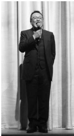
開演に先立ちあいさつする 久木田支部長