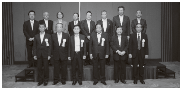
会長以下新三役と新理事