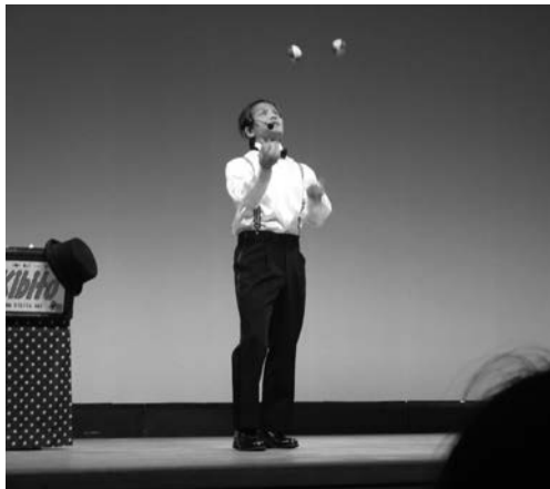
大道芸を披露する「キビート」