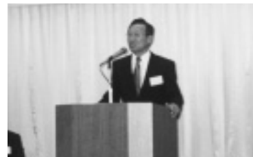
仕幸事務局長あいさつ