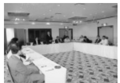
静岡支部総会(中央は山浦前支部長)