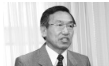
仕幸専務理事あいさつ