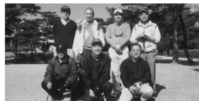
会社のゴルフ同好会での一コマ「この会ではいつも1.5Fする」とはご本人の弁

「人との出会い、一期一会。そんなことが趣味の世界にもありそうですね。いろいろやってみる中で、愉しめたも自分なりに選択していけばいいんじゃないですか」と中川氏は結んでくれた。