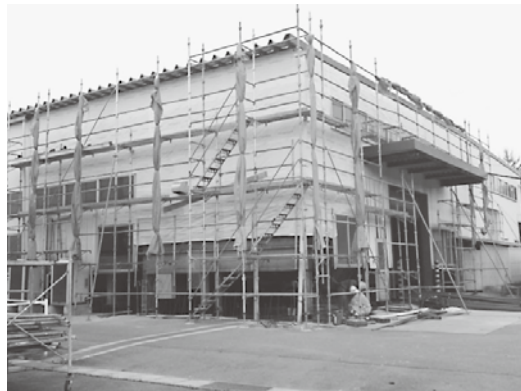
ジャッキアップとともに基礎部分も鉄筋から打ち直し、沈下から復旧中のテクニカルセンター・第2工場

また、現在でも自宅に戻れない社員もおりますが、働く場所の有無は精神的に大きな支えとなっています。現在、当事業所では工場の再稼働に向けて準備を進めているところです。必ず、皆様のご期待に沿えるようがんばってまいりますので、いましばらくお待ちください。よろしくお願い申し上げます。