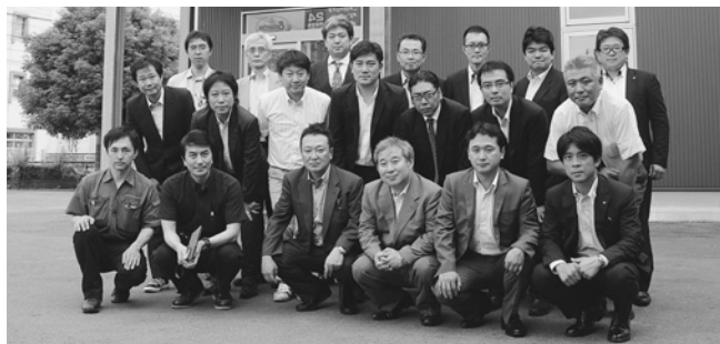
見学先の加冶金属工業で