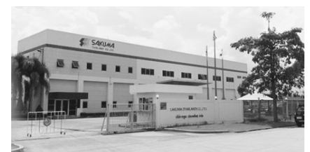
タイ現地法人 SAKUMA (THAILAND) CO., LTD.