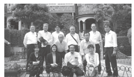
市内見学には13名が参加し、自然豊かで歴史文化の厚重的な神戸の魅力堪能した