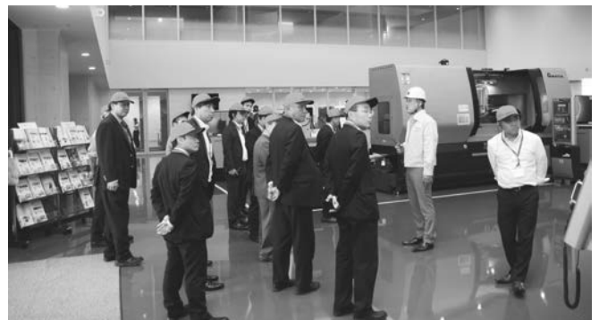
見学先のアマダマシンツール土岐事業所