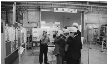
16名が参加し、熱心に見学が行われたアサヒフォージ土岐工場