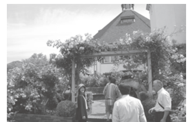
彩りに加え、さまざまな香りも楽しみながら園内を散策