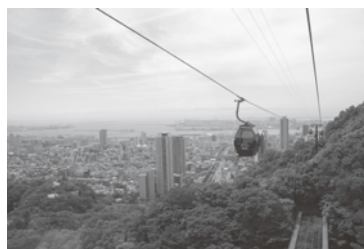
標高400mのハーブ園山頂駅からは神戸市内の展望が楽しめる

13名が参加し、チャーターバスで移動しながら神戸市内を見学した。はじめに、「神戸布引ロープウェイ」を利用して、国内最大級のハーブ園といわれる「神戸市立 布引ハーブ園」を見学。六甲山の一角の斜面にレイアウトされた園内を散策しながら、季節の花とハーブに触れることができ癒やしのひとときをすごした。その後は、神戸のチャイナタウンである南京町を見学し、昼食をとった後は、歴史的建造物の建ち並ぶ神戸北野の異人館地区を散策。「うろこの家」では、110年以上を経た建築や家具・調度品などを見学し、神戸の奥深い歴史を実感した。