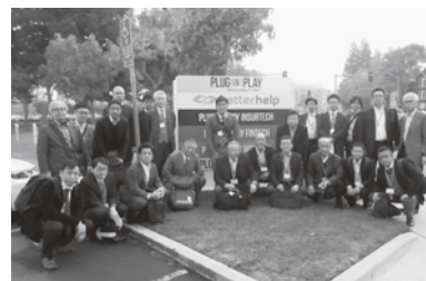
Plug & Play Tech Center前にて