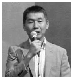
あいさつする碓井東京支部長