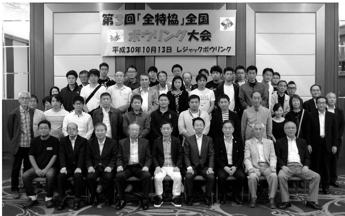
第3回目の全国大会は名古屋を舞台に参加12チーム36名(男性32・女性4)で行われた

全特協は10月13日(土)、名古屋市中村区のレジャック・ボウリングで「第3回 全国ボウリング大会」を開催した。参加チームは全国の各支部の予選で選抜された11チームに事務局チームを加えた全12チーム。本部・支部役員を含めた関係者58名が参加した。ゲーム終了後には表彰式と懇親会も行われ、全特協唯一の全国的な福利厚生イベントにふさわしい支部の垣根を超えた交流が図られた。