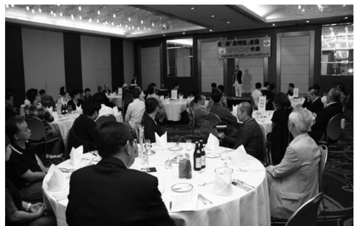
表彰式と懇親会は「キャスルプラザ」に会場を移動して行われた