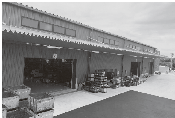
既存3工場を集約し、効率化とともに品質管理も強化された「北崎IC工場」

趣味はドライブで、過去にはキャンピングカーも所有し、全47都道府県を走破したほど。家族は夫人と二男一女の5人家族。「子供が小さいころは車にワッと放り込んで出かけ、自然の中で過ごすというスタイル。いまは子供たちがスポーツに取り組んでいたり受験シーズンだったり遠出もままなりません。いずれ落ち着いたら妻とのんびり出かけたいものですね」と公私ともに慌ただしい中での抱負を聞かせていただいた。